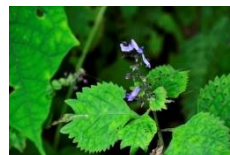
カメバヒキオゴシ