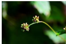
アキノウナギツカミ