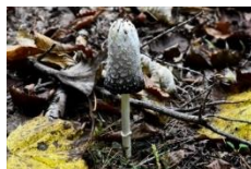
ササクレヒトヨタケ