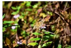
ミドリヒョウモン