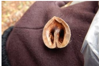
ニホンリスの食痕