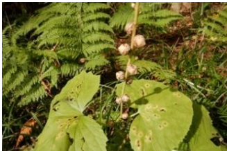
タマブキでしょうか？