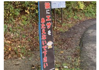
サルに餌を与えないでください