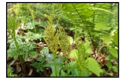
ハナワラビの仲間