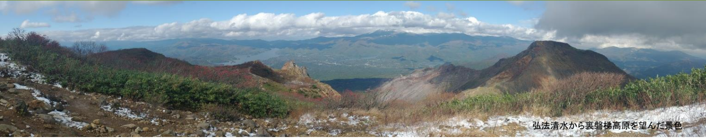
弘法清水から裏磐梯高原を望んだ景色

磐梯山（裏磐梯登山口） 【難易度】★★★（上級） 片道約5.4km（約3時間30分）