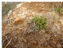
パンダイクワガタ