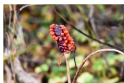
テンナンショウの仲間