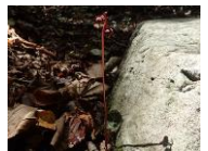
ヒツバイチャクソウの実