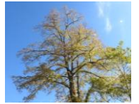
オオバボダイジュ