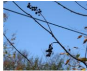
ウワミズザクラ(実)