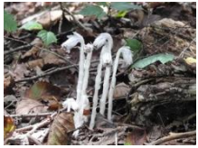
ギンリョウソウモドキ