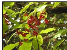
ヒロハノツリバナ