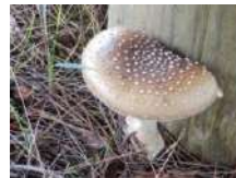
テングダケのなかま