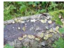
朽木のキノコ(種類不明)