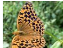
オオウラギンスジヒョウモン