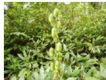
オオウバユリの実