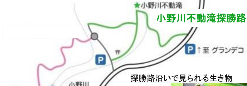
小野川不動滝探勝路