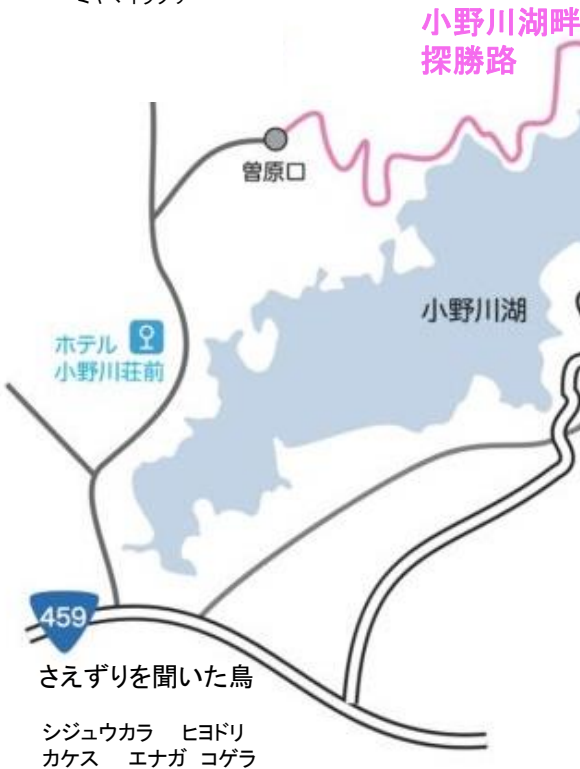
小野川湖畔探勝路