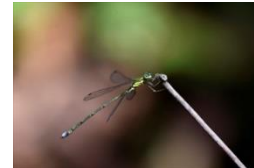
オオアオイトンボ