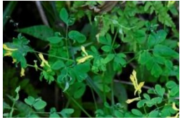
ナガミノツルケマン