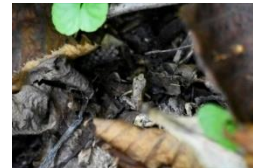
アカガエルの仲間