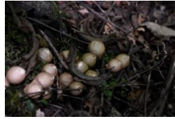
ホコリタケの仲間