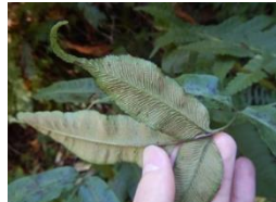
イワガネゼンマイ