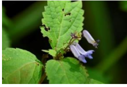
カメバヒキオコシ