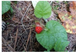
コバノフユイチゴ