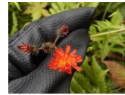
コウリントンポポ （外来種）