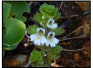
ミヤマコゴメグサ