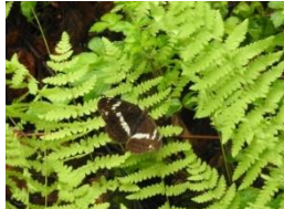
イチモンジチョウ