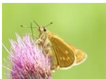
コキマダラセセリ