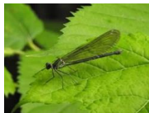
ニホンカワトンボ