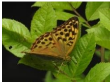
ミドリヒョウモン