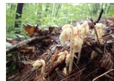
シャクジョウソウ