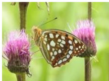
ウラギンヒョウモン