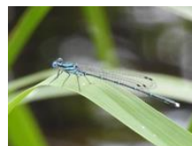
アマゴイルリトンボ