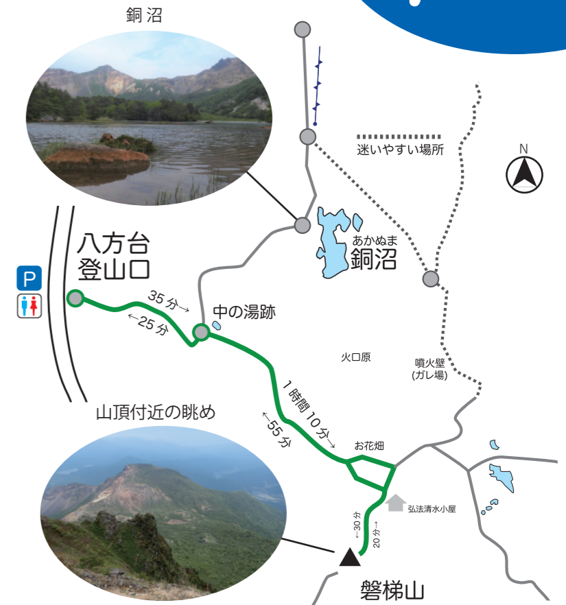
図3. 磐梯山登山道（八方台登山口～山頂）

磐梯山頂付近からは1888年の噴火によって出来た爆裂火口や、天気が良ければ猪苗代湖を一望できます。まだ登ったことがない方は、この夏、磐梯山登山にチャレンジしてみてもはいかがでしょうか？