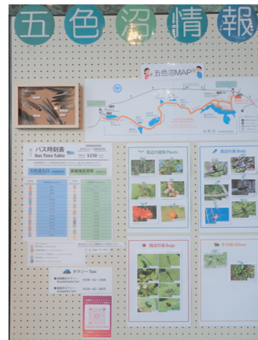
図4. 館内入口付近の五色沼情報