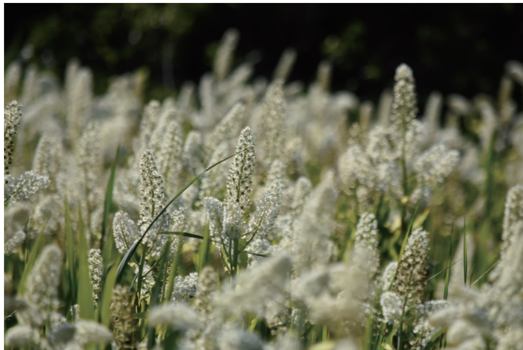
図1. 雄国沼のコバイケイソウ Veratrum stamineum Maxim.

コバイケイソウは、北海道と本州中部以北に分布する日本固有の植物で、山地から亜高山帯の湿原に生育します。コバイケイソウは、3～4年に一度花を咲かせるといわれ、花の量は毎年変わりますが、今年の雄国沼湿原では、十数年に一度といわれる大当たりの年だったようで、一面が白い花に包まれるような景色が広がりました。