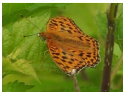
ウラギンヒョウモン