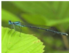
アマゴイルリトンポ