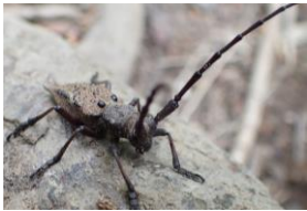
コバヤハズカミキリ