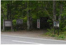
八方台登山道入り口