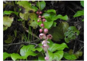
ベニバナイチヤクソウ