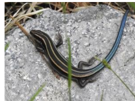
ヒガシニホトカゲ