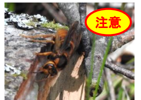
キイロスズメバチ