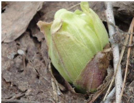
▲フキノトウ（若い花茎のこと）

フキノトウが地面から顔を出し、いよいよ裏磐梯にも春がやってきたことを感じますね。 なじみ深いけれども意外と知らない、春の味覚フキについて調べてみました。