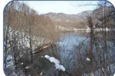
⑥ 探勝路から見る曾原湖 グリーンシーズンは木々の葉でほとんど見えなかった曾原湖が見渡せました。