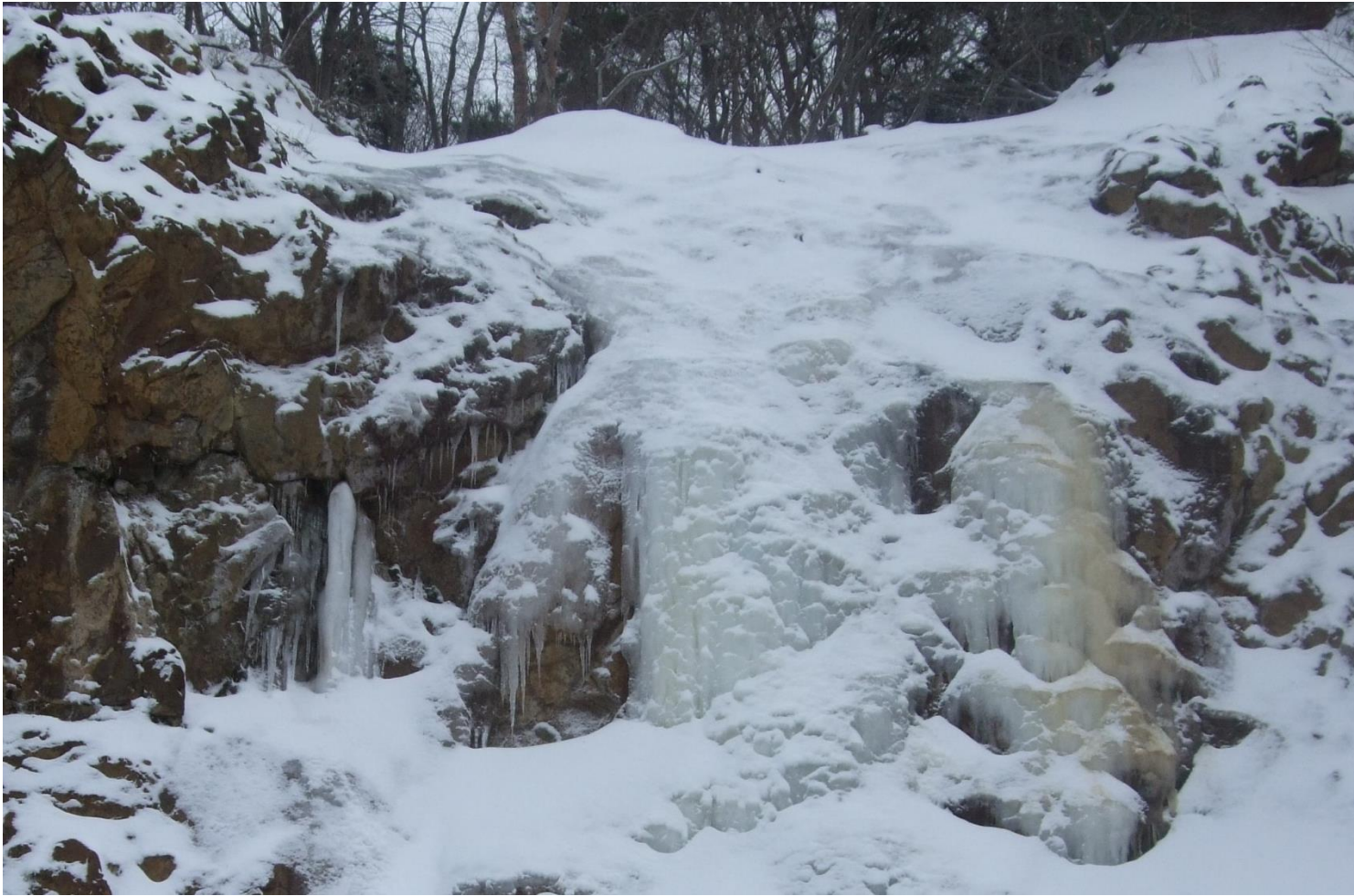
▲イエローフォール

暖冬の影響で例年より雪が少なく、冷え込む日も少ない裏磐梯ですが、ようやく裏磐梯の冬らしい景色になりつつあります。