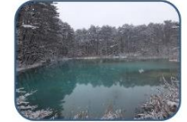
⑦ 青沼 雪の白と沼の青のコントラストが美しいです。