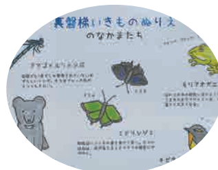
▲「ぬりえ」の仲間たち