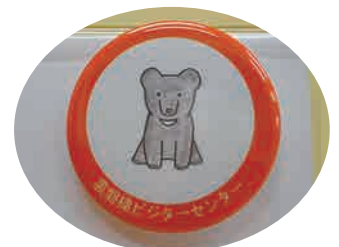
▲オリジナル缶バッジ