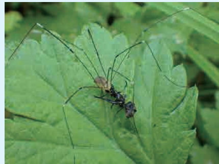
▲エサをくわえている様子