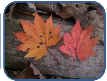
③コハウチワカエデ