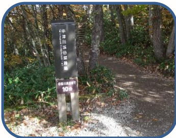
①中津川溪谷探勝路の入口です。