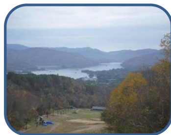
①ゲレンデ上部から見た松原湖