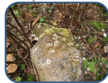
④オオウバユリの種子

○「わくわく散歩」随時受付中です！ ○スノーシューや長靴、双眼鏡をレンタルしています。 ○散策前に、コース状況や自然情報などの確認にお立ち寄りください。Webでも随時、情報発信しています。 ○お電話でのお問い合わせもお気軽にどうぞ。