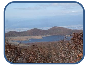
③猫石から見た雄国沼