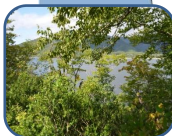
⑤ 木々の間から桧原湖が見えました。