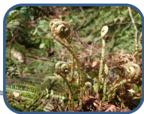
④シダの仲間の新芽