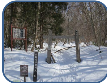
③探勝路入口の鳥居