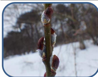
②ヤナギの仲間の芽