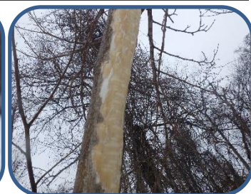
③ニホンザルの食痕