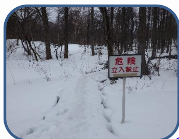
①立ち入り禁止箇所