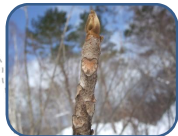
④ヤマウルシの冬芽と葉痕