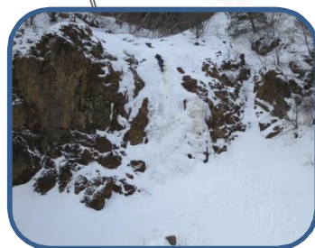
⑤イエローフォール

○「わくわく散歩」随時受付中です！ ○スノーシューや長靴、双眼鏡をレンタルしています。 ○散策前に、コース状況や自然情報などの確認にお立ち寄りください。Webでも随時、情報発信しています。 ○お電話でのお問い合わせもお気軽にどうぞ。