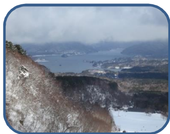
①グレンデ上部から見た椗原湖

※道路凍結によるスリップ事故が発生しています。夜間や早朝等、車の運転にはくれぐれもご注意ください。