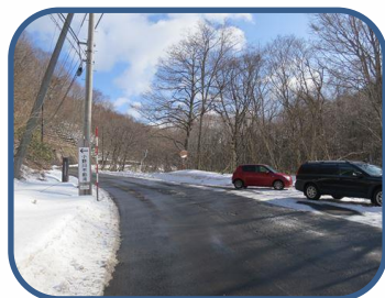
①冬季は道路脇の看板が目印です。