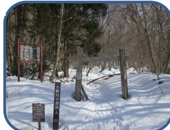
③さあ、探勝路入り口です。