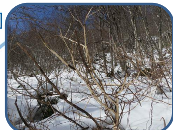
⑤ニホンザルの食痕？