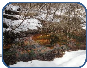
④美しい酸化鉄の水たまり