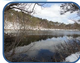
⑧結氷していない柳沼

裏磐梯ビジターセンター(福島県耶麻郡北塩原村) TEL: 0241-32-2850 開館時間: 9:00~16:00(12~3月) 休館日: 火曜日(祝日の場合、翌日が振替休館)