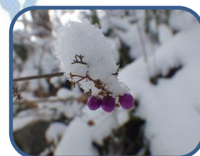
⑥ムラサキシキブの果実