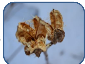
③オオウバユリの果穂