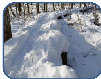
②木道の踏み外しに注意