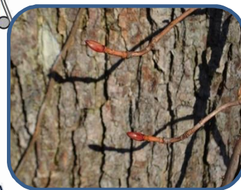
④ツルアジサイの冬芽