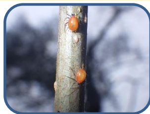
①ニワトコヒゲナガアブラムシ?