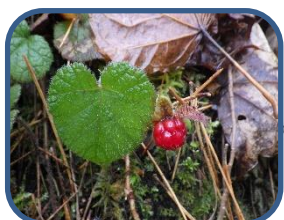
④コハノフユイチゴの果実