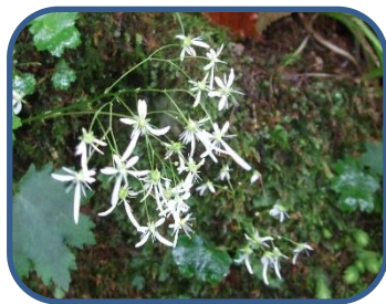
③ダイヤモンドソウ