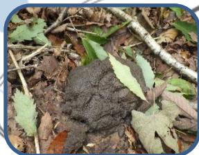
⑥ツキノワグマの糞