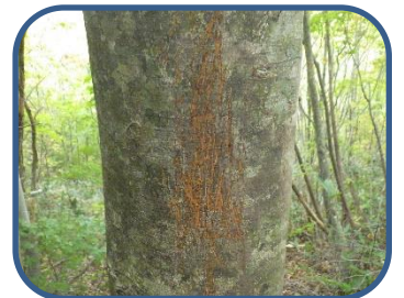
④ツキノワグマの爪痕