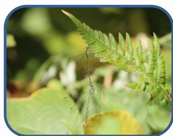
①オオアイトトンボ