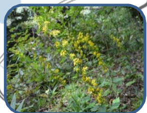
⑥アキノキリンソウ