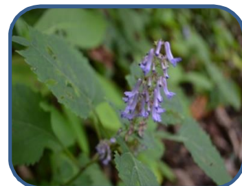
④カメバヒキオコシ