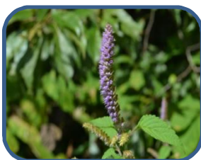
⑦ナギナタコウジュのなかま