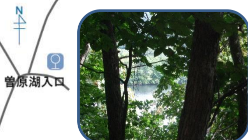
④探勝路からみた曾原湖