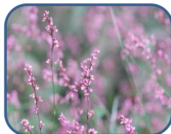
④イヌタデのなかま

裏磐梯ビジターセンター (福島県耶麻郡北塩原村) TEL: 0241-32-2850 開館時間: 9:00~17:00 (4~11月) 休館日: 夏休み期間(8月31日まで)は毎日開館