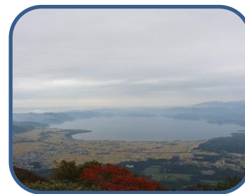
⑥山頂からの猪苗代湖