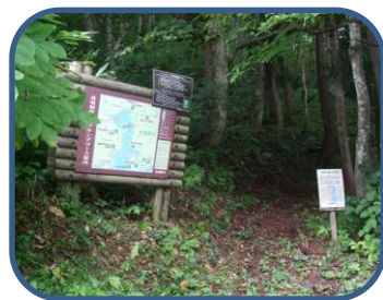
①探勝路入口(松原集落口)

特徴：松原地区から南に延びる尾根筋を通り、「裏磐梯野鳥の森探勝路」の展望台へ向かうコース。ブナやミズナラ、トチノキ、カエデなどの広葉樹の森が広がり、樹林の切れ目からは、西吾妻山や松原湖の眺望を楽しむことができる。探勝路は、自然(山)の中のコースです。山歩きのできる用意をしましょう。