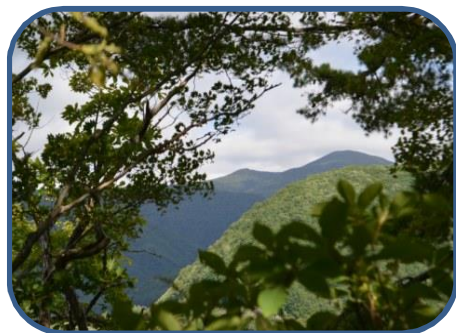
④西大巔と西吾妻山 木々の隙間から眺められました。