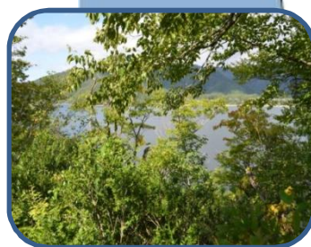
⑤岬先端付近からの桧原湖