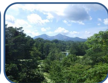
⑤中瀬沼展望台からの景色

裏磐梯ビジターセンター (福島県耶麻郡北塩原村) TEL: 0241-32-2850 開館時間: 9:00~17:00 (4~11月) 休館日: 夏休み期間(8月31日まで)は毎日開館