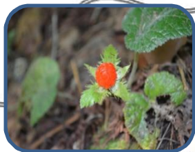
④マルバフユイチゴ