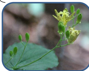
①タマガワホトトギス

特徴：西大巔、西吾妻中腹から木材を運搬するために走っていたトロッコの軌道敷をトレッキングコースとして整備したコース。石積みの橋脚など、当時の名残を見ることがもできる。落差約25mの小野川不動滝は、季節ごとに色々な姿を見せてくれる。探勝路は、自然(山)の中のコースです。山歩きのできる用意をしましょう。