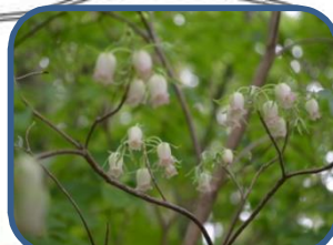
⑤ガクウラジロヨウラク