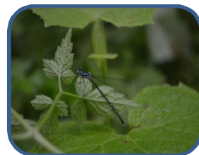
③アマゴイルリトンボ