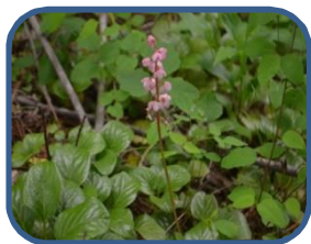
①ベニバナイチヤクソウ