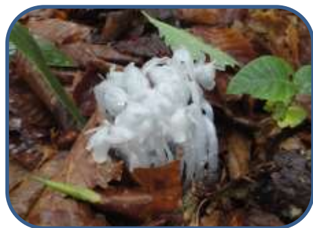
③ギンリョウソウ 花の盛りを迎えていました。