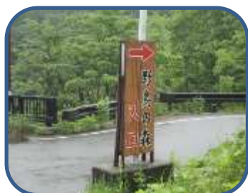
①コース案内看板（松原口）

特徴：松原地区から南に延びる尾根筋を通り、「裏磐梯野鳥の森探勝路」の展望台へ向かうコース。ブナやミズナラ、トチノキ、カエデなどの広葉樹の森が広がり、樹林の切れ目からは、西吾妻山や松原湖の眺望を楽しむことができる。探勝路は、自然(山)の中のコースです。山歩きのできる用意をしましょう。